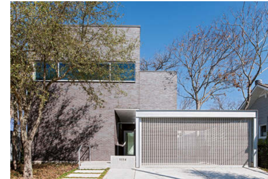
en el que se demuestra la funcionalidad de la economía de los materiales empleados durante la construcción.