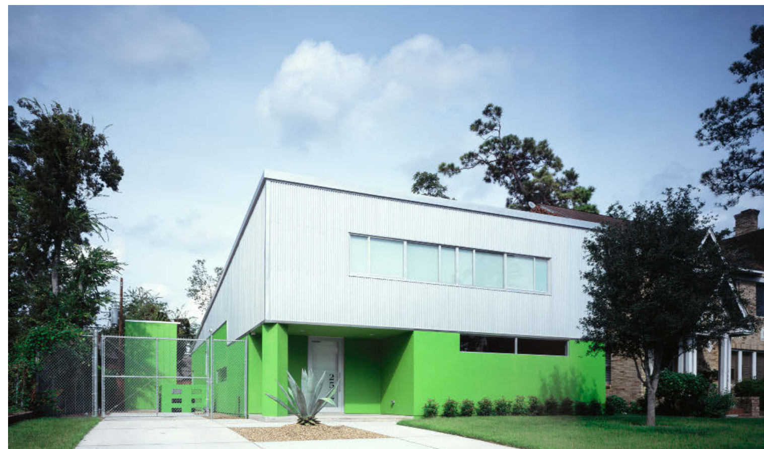
Izquierda , arriba, Irwin Mortgage Headquarters, edificio de más de 11.000 m 2 dividido en cuatro pisos que alberga los despachos de dirección, las oficinas administrativas, el almacén y el servicio de correos. Perpendicular a la autopista Interestatal 69, el arquitecto utilizó el propio edificio como anuncio de la compañía –fue uno de los requisitos requeridos por el cliente–. Izquierda , abajo, exterior del estudio de fotografía De Santos (2011-2012, Houston, Texas).